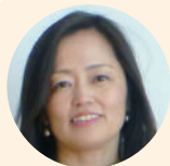
Homedoor 顧問税理士 准認定ファンドレイザー

アンドセンターという新たな挑戦が社会を少しずつ変えていきます。寄付という行為は一方通行ではないはず。その場に寄り添えることが寄付の醍醐味ではないでしょうか。